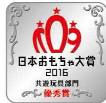
【マーク使用イメージ】