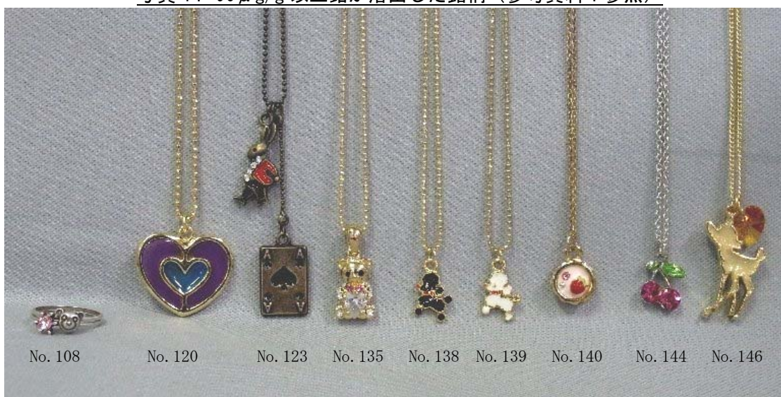
写真1. 90 \mu g/g以上鉛が溶出した銘柄(参考資料1参照)