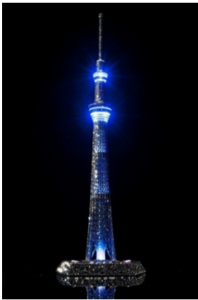
MADE WITH SWAROVSKI® ELEMENTS

昨年発売されたライティングスケールモデル「1/1000東京スカイツリー®」に、スワロフスキー・エレメントを“約30,000ピース”デコレーションしたスペシャルバージョン。実際の東京スカイツリー®に近づけた「粹風」「雅風」「時計光」の他、「さくら」「新緑」「夏空」「ハロウィン」「クリスマス」「正月」「ライト」「レインボー」の8種類のオリジナルライティングを用意。スワロフスキー・エレメントの煌めきとライティングの相乗効果により、スケールモデルの域を超えたインテリア性を実現しました。専用キャリーケースと展示用アクリルボックス付属。